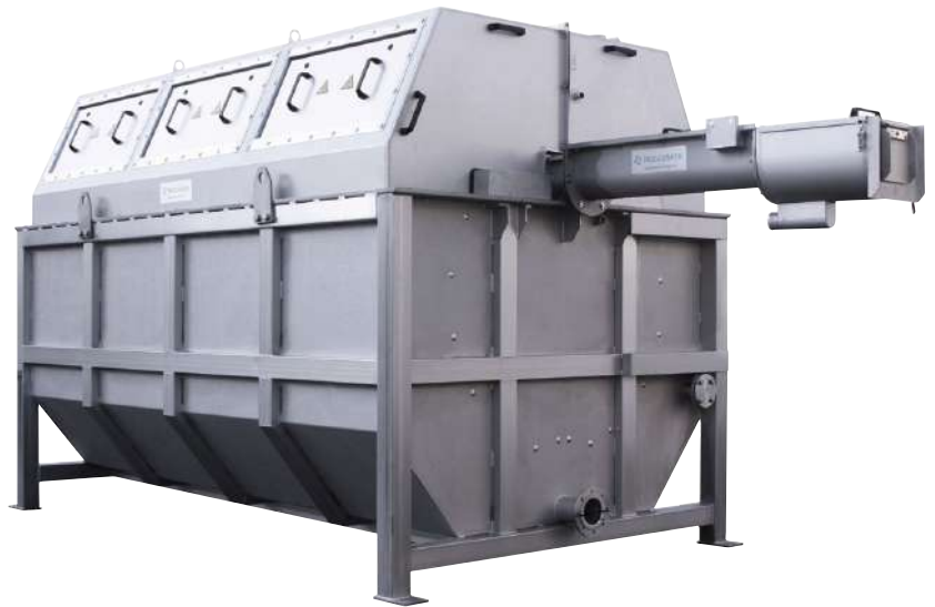
Trommelsieb Behältervariante, RSH-MG