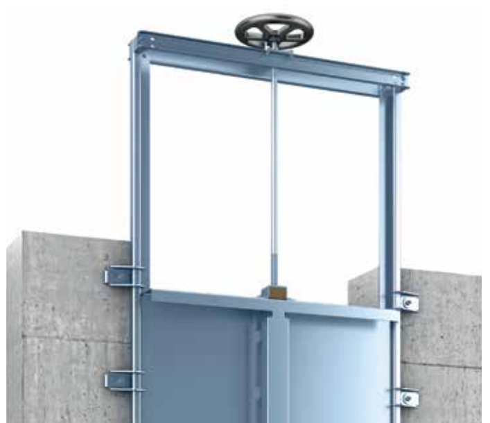
Vannes guillotines Passavant®