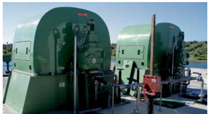
Filtre à chaînes Geiger®