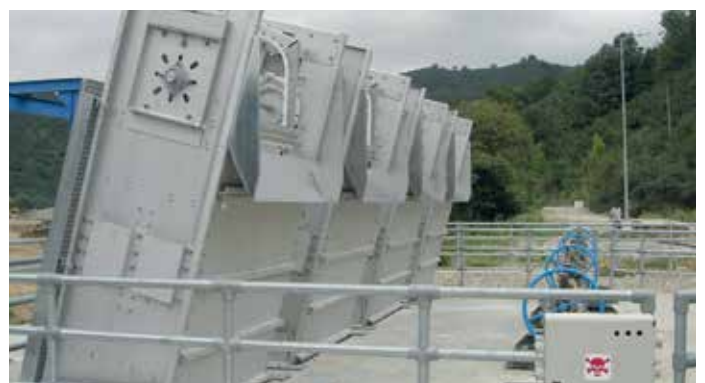
Dégrilleur à chaînes «haute capacité» Geiger®