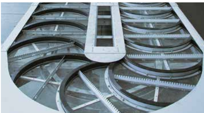
Dégrilleur MultiDisc® Geiger