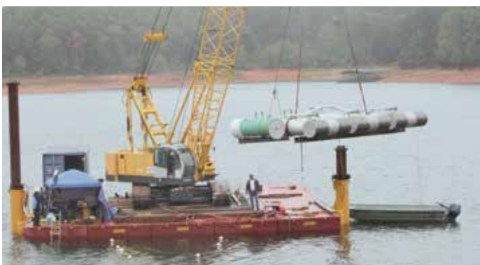
Prise d'eau passive Johnson Screens®