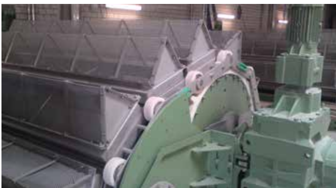
Filtre à chaînes à flux central Geiger®