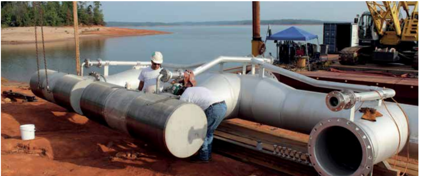
Installation de prise d'eau passive Johnson Screens® : usine d'eau potable, Caroline du Nord, États-Unis