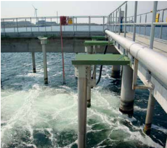
Système de répulsion des poissons Geiger®