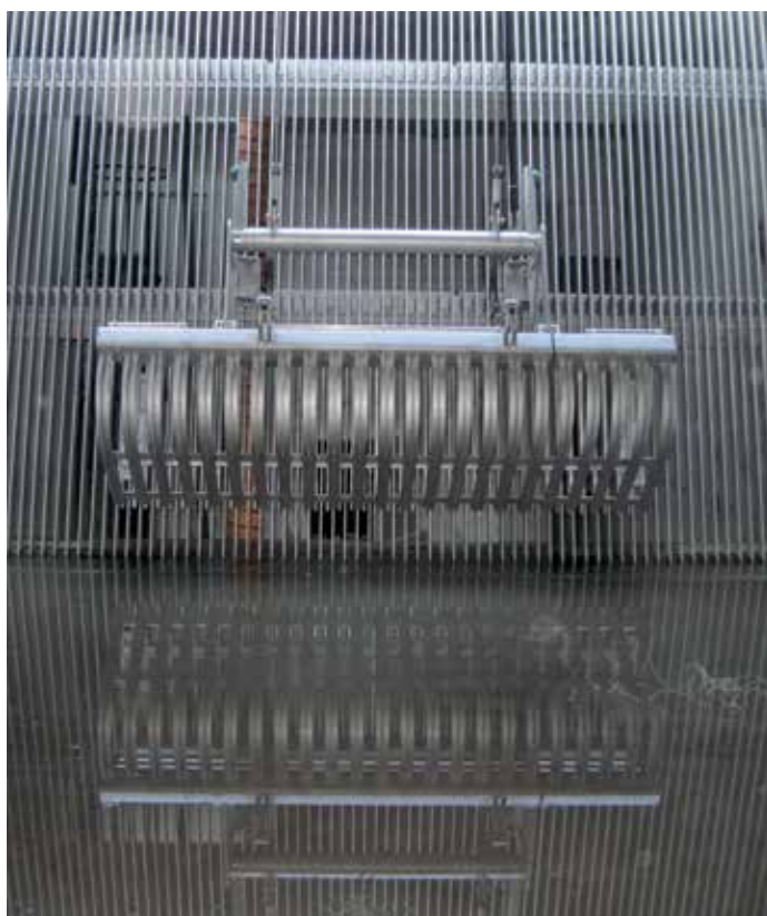
Dégrilleur à grappin suspendu Geiger®