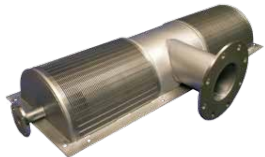
Demi-prise d'eau passive Johnson Screens®