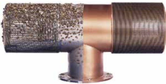
Prise d'eau passive Johnson Screens® (moitié acier inoxydable (côté gauche), moitié en Z-alloy Z (CuNi) (côté droit))

Au fil du temps, divers débris vont s'amasser sur la surface filtrante de la prise d'eau et un nettoyage périodique sera nécessaire afin de conserver un bon fonctionnement de celle-ci. Notre système Hydroburst™ offre un moyen de nettoyage efficace et régulier sans avoir recours à des plongeurs pour nettoyer les prises d'eau. Ce système est conçu pour fournir un volume important d'air comprimé en quelques secondes, procédé qui a fait ses preuves dans tous les types d'application et dans toutes les conditions. Ces volumes d'air sont éjectés du fond de la prise d'eau; et alors qu'ils s'élèvent et s'étendent, ils emportent avec eux les débris présents à la surface de la prise d'eau, nettoyant cette dernière pour un fonctionnement optimal. Nos ingénieurs évaluent la taille de la prise d'eau, sa profondeur ainsi que sa distance de l'Hydroburst™ afin de fournir la quantité d'air adaptée. Les systèmes peuvent être aussi simples qu'une vanne à actionnement manuel, une minuterie programmable ou un automate programmable qui communique avec un système central de contrôle des données (SCADA) pour pilotage.