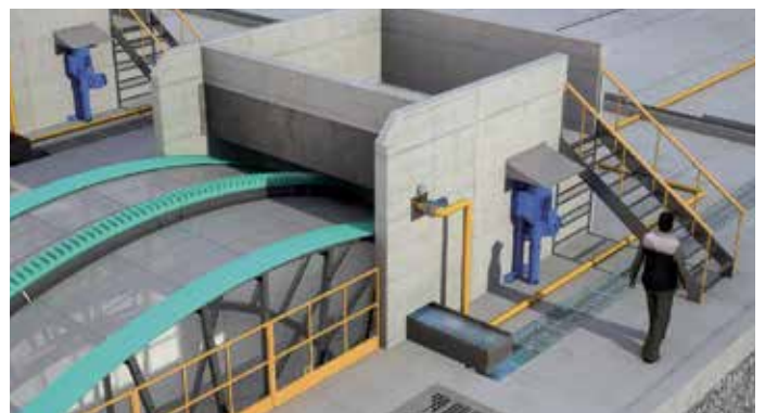
Geiger® tamis grande capacité