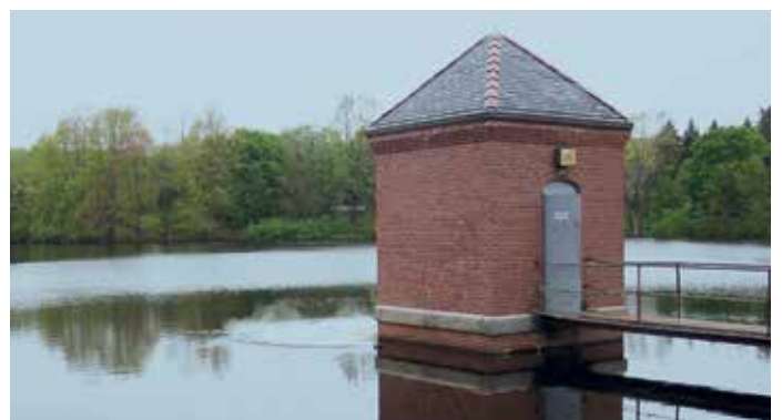
Hydroburst™ en fonctionnement