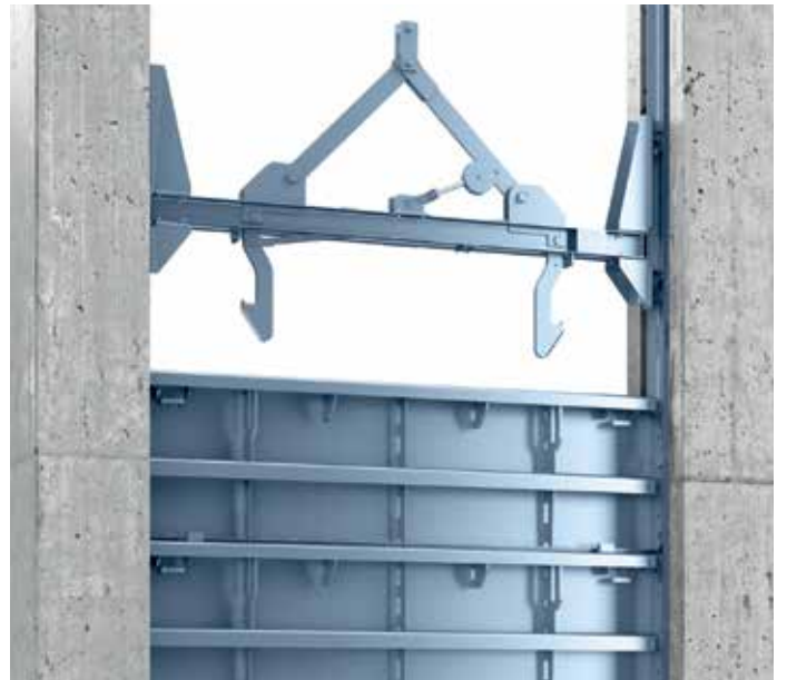
Batardeau Geiger® avec équipement de levage