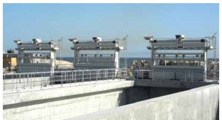
Dégrilleur à godet Geiger®