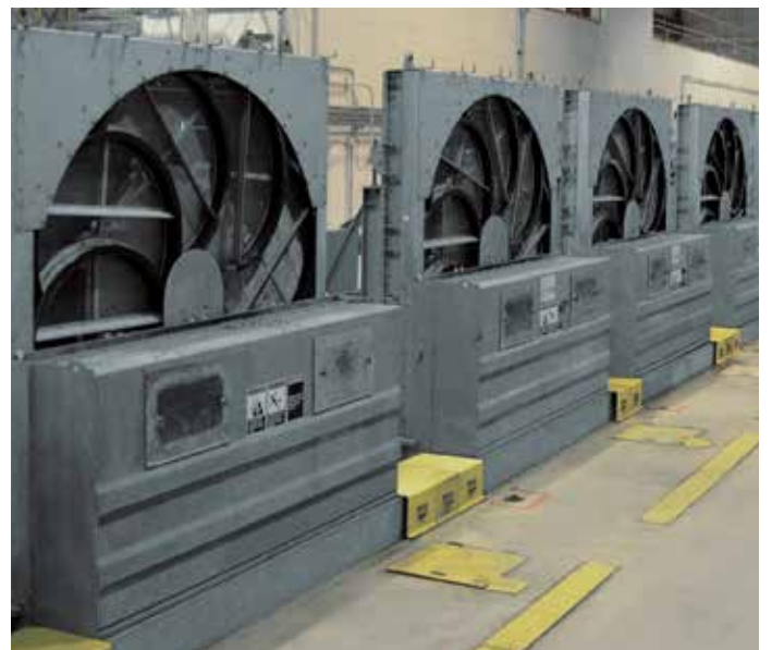
Centrale nucléaire DC Cook, États-Unis