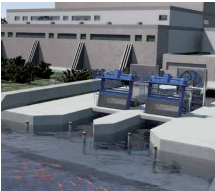
Prise d'eau à deux canaux avec système de répulsion des poissons Geiger® et système automatique de renvoi des poissons Geiger®