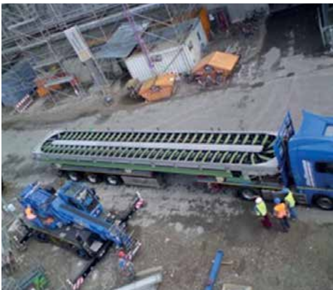
Centrale électrique GKM 9, Mannheim, Allemagne